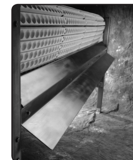
Évacuation sur le côté