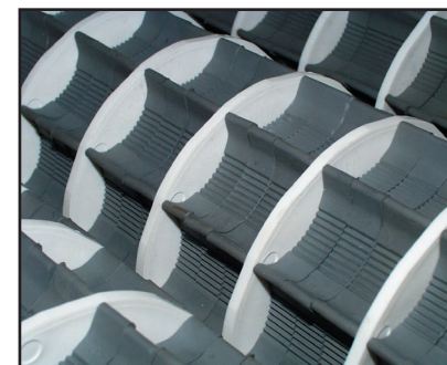
Alvéoles du calibreur rotatif